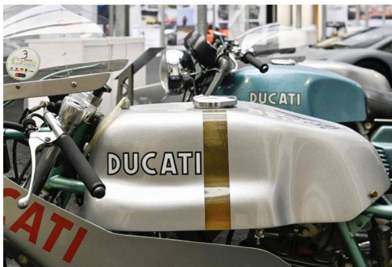
Motor Valley Fest 2023, anche le moto