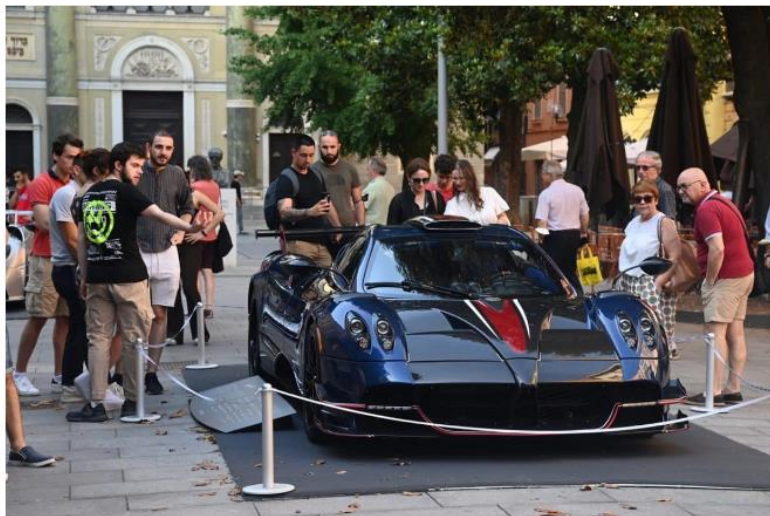
Motor Valley Fest 2023, tripudio di passione

Nella giornata di sabato gli equipaggi partecipanti sfileranno per le strade modenesi alla scoperta del Museo Ferrari di Maranello, della Collezione Righini a Castelfranco Emilia e della Reggia Ducale Estense a Sassuolo. La domenica mattina tutte le auto in gara saranno schierate sul "green carpet" del parco di Salvarola Terme e si faranno ammirare allo stabilimento liberty delle Terme della Salvarola.