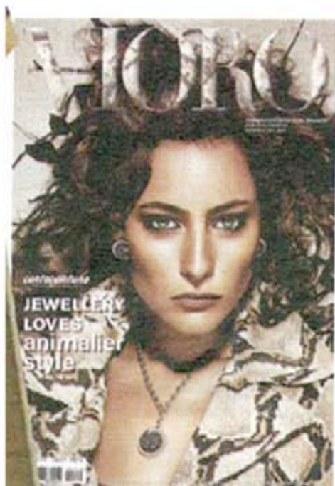
La copertina di settembre di Vioro Magazine

Sfogliando le pagine di Vioro Magazine di settembre 2010, la rivista B2B ufficiale della Fiera di Vicenza, distribuita in tutto il mondo, siamo rimasti positivamente colpiti dalle contraddizioni che emergono, mettendo in stretta relazione la moda internazionale e la gioielleria. Così le anticipazioni dell'autunno-inverno 2010 ci confermano che l'arte orafa vive un momento di grande creatività. Il bianco e il nero guidano le linee più eleganti e raffinate, confermando che lo stile non passa mai di moda. Non per questo sentiremo la mancanza dei colori, anzi: tutte le sfumature dell'autunno nella nuance «smoky» accompagnano e sottolineano alla perfezione l'oro e la sua luce. Troveremo bellissime creazioni dalle forme morbide e rotonde, un trend femminile e seducente. Un tema che si fa strada e che convince sempre più è la natura: fiori, foglie, frutti e tanti animali, figure declinate in tutti gli stili per adattarsi ad ogni look. Per chi va controcorrente e preferisce lo stile metropolitano, non mancheranno gli spunti per «indossare la città»: metalli bruniti, texture geometriche, accenti gotici e catene «heavy metal».